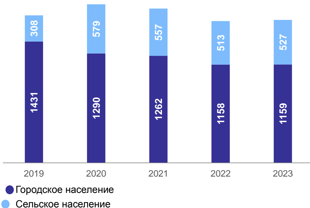
Рисунок 1. Количество опрошенных респондентов при проведении Выборочного федерального статистического наблюдения состояния здоровья населения в Саратовской области в 2019 – 2023 гг., человек.

численности населения региона, что позволяет обеспечить представительность итогов наблюдения по населению страны в целом и по отдельным демографическим группам. В 2023 году в Саратовской области по вопросам для взрослого и для детей было опрошено 1686 респондентов, при этом 68,7% составило городское население, 31,3% – сельское (Рисунок 1).